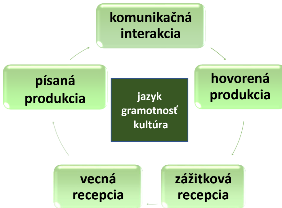
Schéma 1 Predmetové komponenty vo vyučovaní prvého jazyka

zážitková recepcia ) venuje pozornosť aj porozumeniu rôznych žánrov vecného textu v osobitnom komponente vecná recepcia .