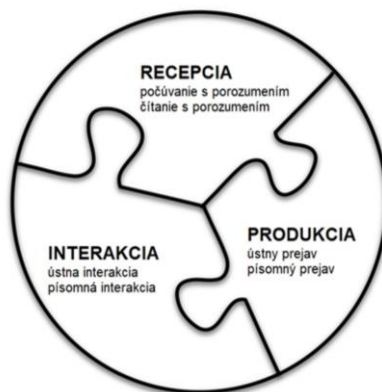
Obr. 1: Komponent vzdelávacej podoblasti JaK CJ

V porovnaní s výkonovým štandardom z roku 2015 došlo k úprave pojmov tak, aby korešpondovali s vyššie uvedenými komunikačnými jazykovými činnosťami (napr. ústny prejav – dialóg bol nahradený pojmom ústna interakcia a ústny prejav – monológ pojmom ústny prejav). Hoci logika výkonového štandardu ostala zachovaná, jednotlivé výkonové štandardy sú formulované tak, aby bola zreteľná gradácia v rozvíjaní všetkých komunikačných jazykových činností naprieč cyklami.