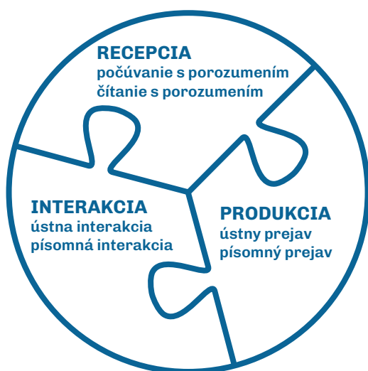
Obrázok 1: Komponent Komunikačné jazykové činnosti

Komunikačné jazykové činnosti sú kľúčom k rozvoju jazykových zručností žiakov a k nácviku reálnych komunikačných situácií. Umožňujú žiakom aktívne sa zúčastňovať na jazykových interakciách, čo prispieva k efektívnosti a motivácii pri učení sa jazyka. Tieto jazykové činnosti sú prítomné na každej vyučovacej hodine a sú prepojené s príslušným obsahom v rámci jednotlivých tematických okruhov. Na hodinách by sa mal klásť dôraz na komunikáciu a rozvoj komunikačných zručností žiakov. Je dôležité poznamenať, že každá jazyková aktivita je prepojená s viacerými prvkami obsahového štandardu súčasne, takže celý obsahový štandard je prítomný vo všetkých častiach komunikačných a jazykových činností.