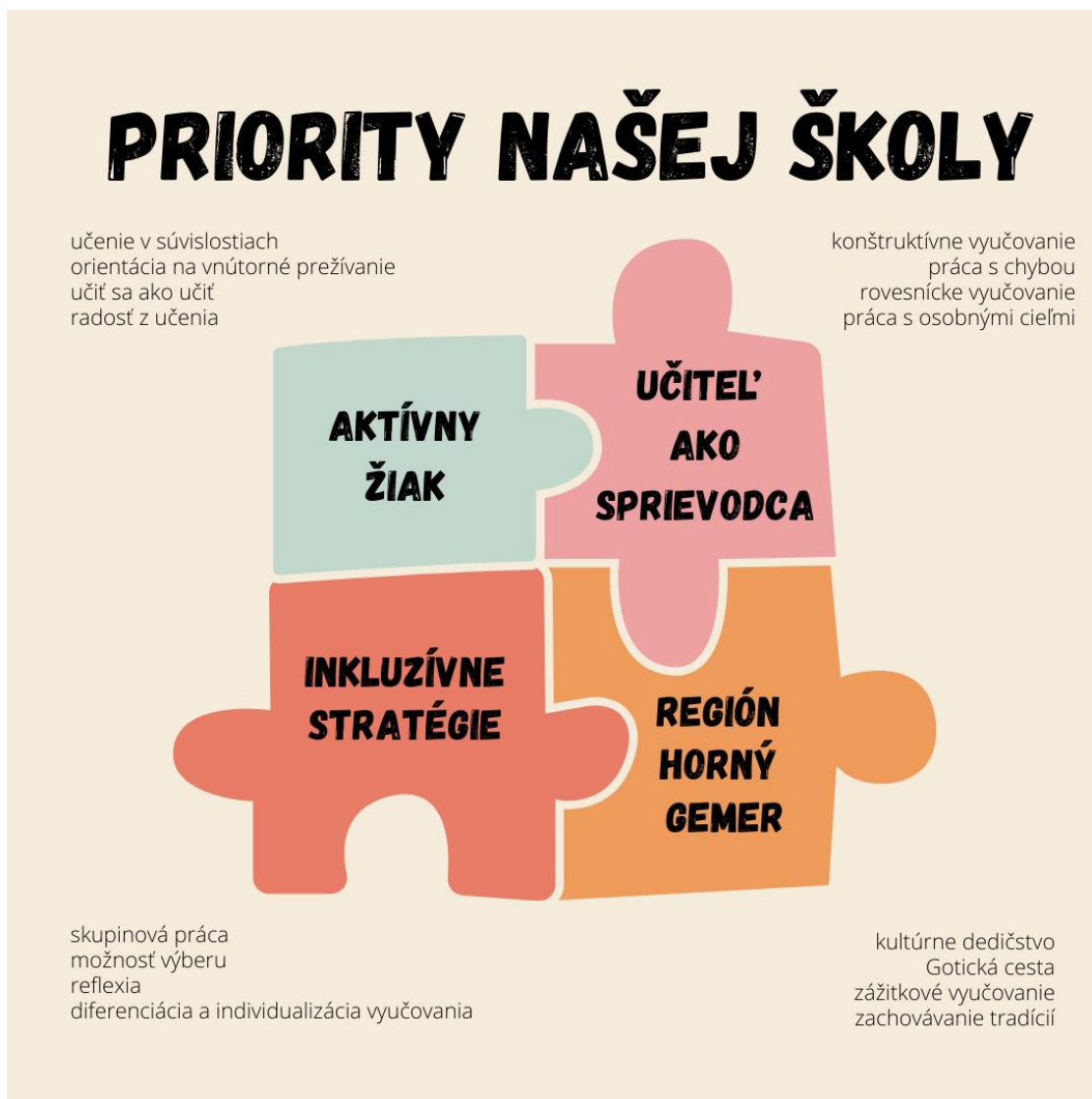
Obrázok 2 Priority ZŠ, Pionierov 1, Rožňava