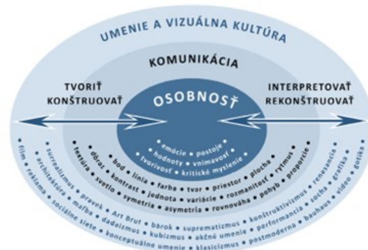
Komponenty vyučovacieho predmetu